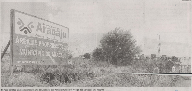
Placa identifica que já será construída uma obra, realizada pela Prefeitura Municipal de Aracaju, mas a entrega é uma incógnita

Até o dia 31 de dezembro deste ano, a PMA não terá tempo de concretizar cerca de 27 projetos em diversos bairros. Alguns, já licitados, poderão ser entregues à população aracajuana em junho de 2013