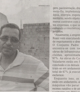
Mantenedor da Coqueiral se ocupa da demora de concretização das obras de infraestrutura