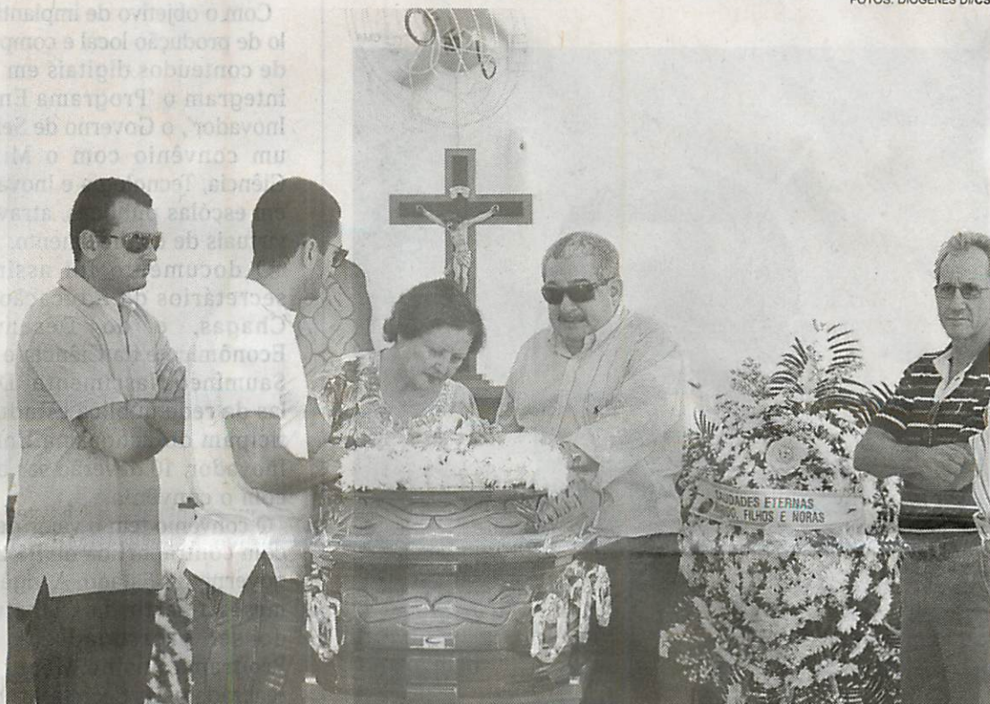
■ Parentes e amigos estiveram no velório no cemitério Colina da Saudade