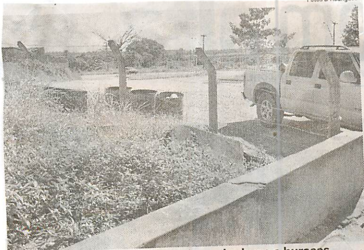
Problemas: mato, arame farpado, rachaduras e buracos

a situação é calamitosa. “Já presenciei um idoso torcer o pé por causa desses buracos no chão. Sem contar que caideirantes também enfrentam muitas dificuldades, não só pelos buracos, mas pela ausência de um banheiro adaptado e de elevador”, diz o agente.